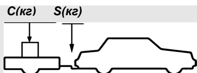
верное размещение груза